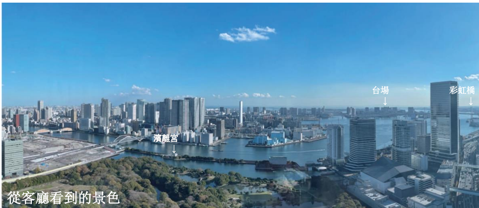
從客廳看到的景色